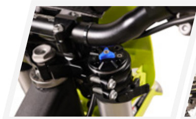
Suspensão com ajuste de cliques