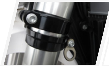
Mesa CNC Cross Fixed