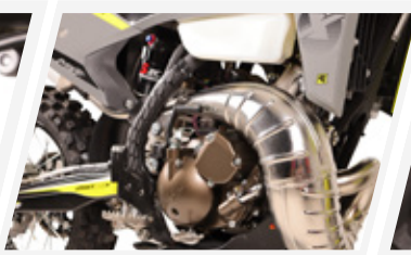
Curva dimensionada e reforçada em inox 1mm