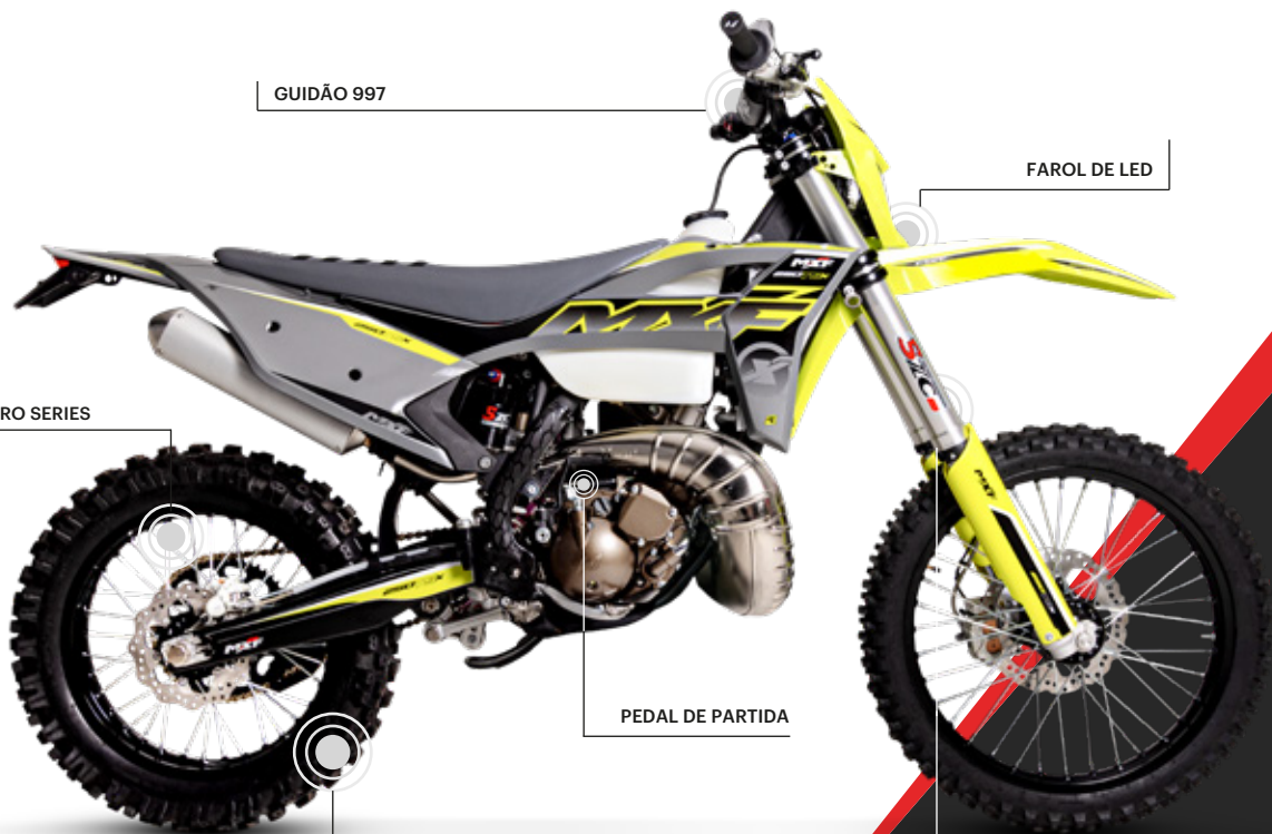
SUSPENSÃO PREPARADA PARA O SOLO BRASILEIRO