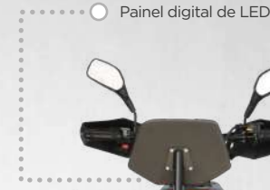
Painel digital de LED