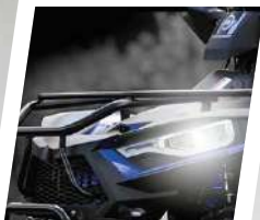
Faróis Full LED DRL