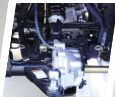
Transmissão 4x2/4x4 comutável eletricamente