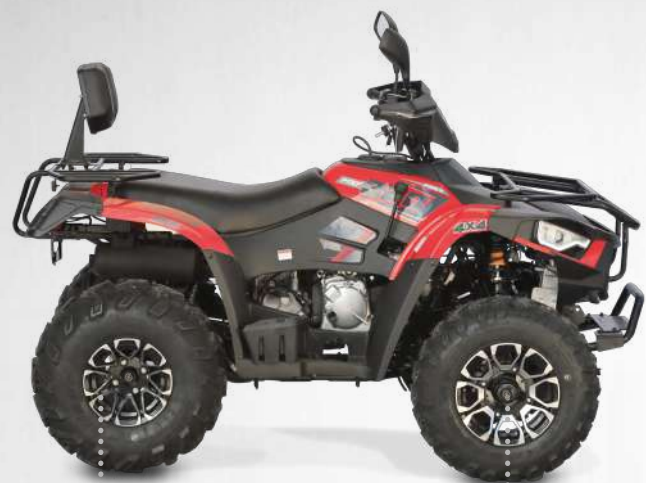
Freios a disco hidráulicos