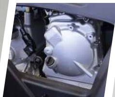
Motor 4 tempos com arefecimento líquido