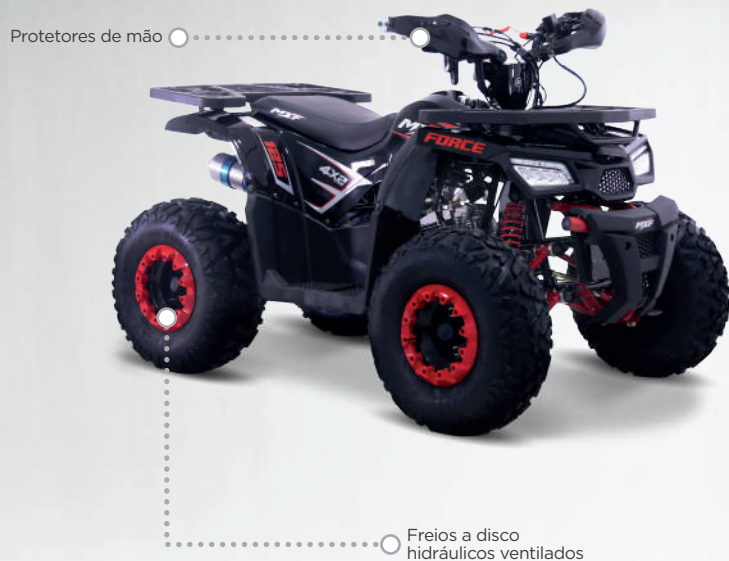
Protetores de mão