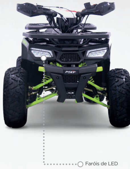
Faróis de LED