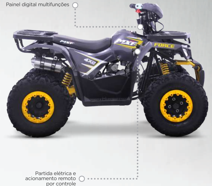
Painel digital multifunções