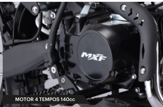
MOTOR 4 TEMPOS 140cc