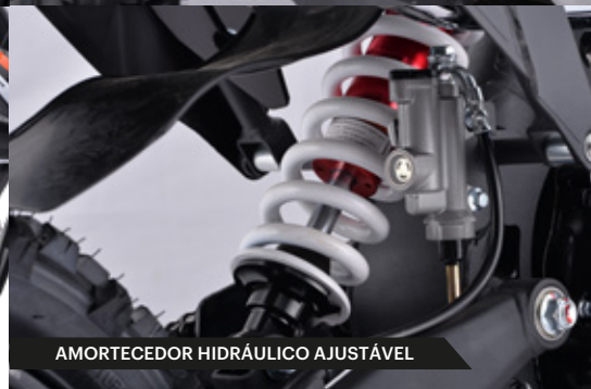
AMORTECEDOR HIDRÁULICO AJUSTÁVEL