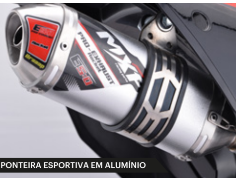
PONTEIRA ESPORTIVA EM ALUMÍNIO