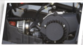
Motor 49 cc 2 tempos