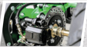
Freios a disco com acionamento a -cabo possui freios estacionários