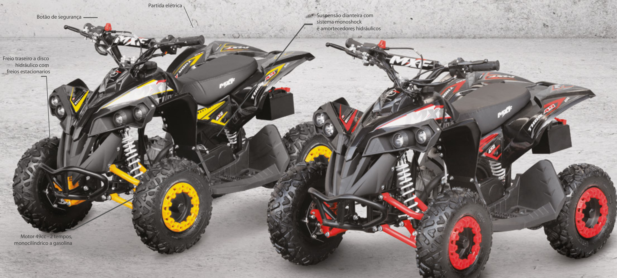
Botão de segurança