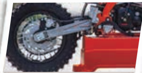
Suspensão traseira hidráulica