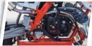
Motor 50 cc 2 tempos