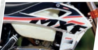
Novo gráfico e conjunto de plásticos