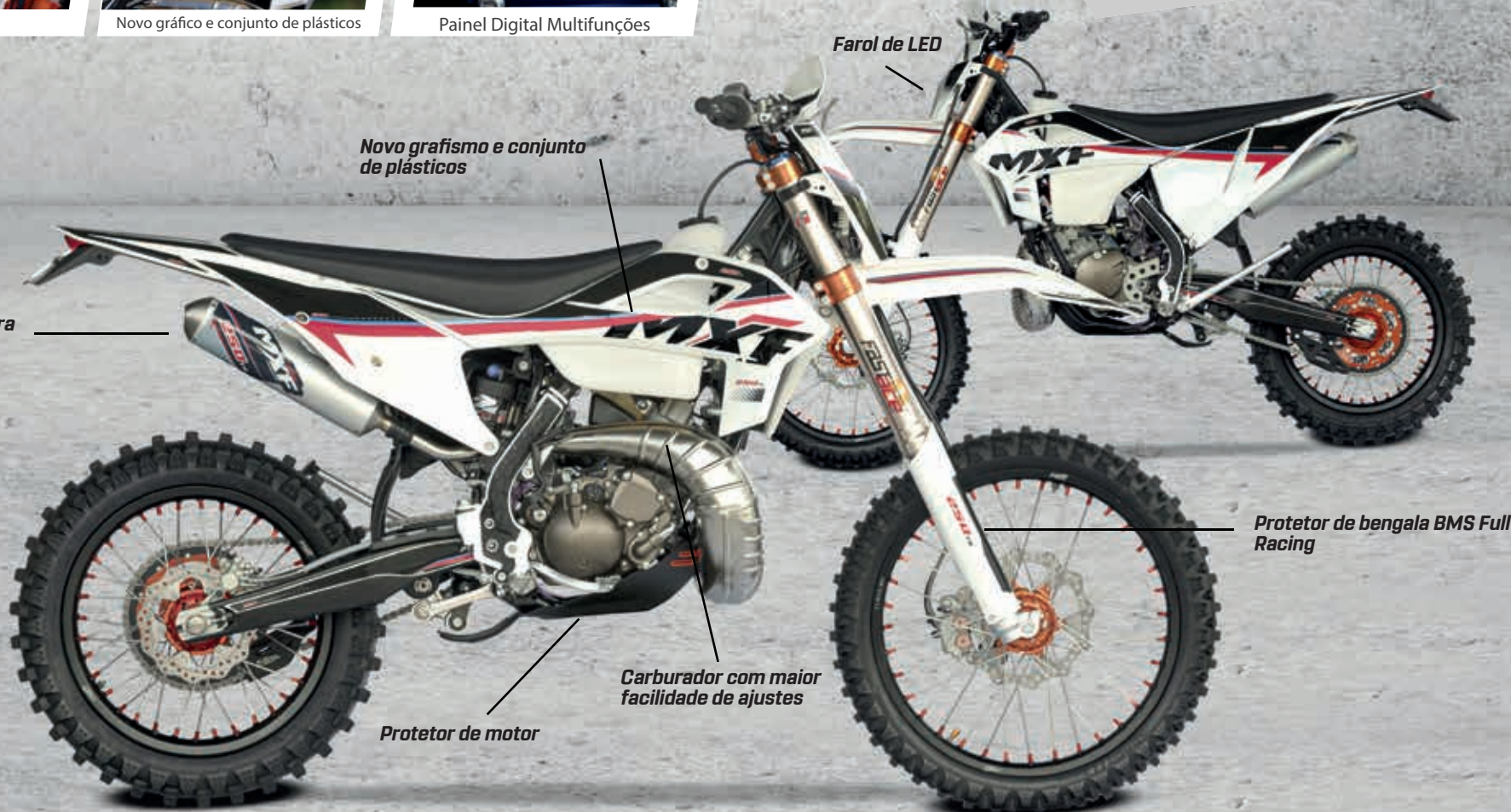
Farol de LED