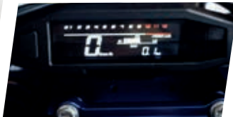
Painel Digital Multifunções