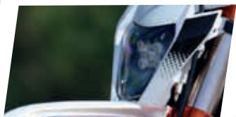
Farol de LED