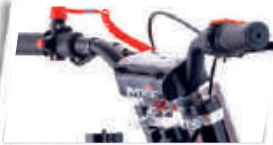
Guidão estilo Fat Bar