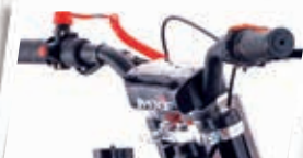
Guidão estilo Fat Bar