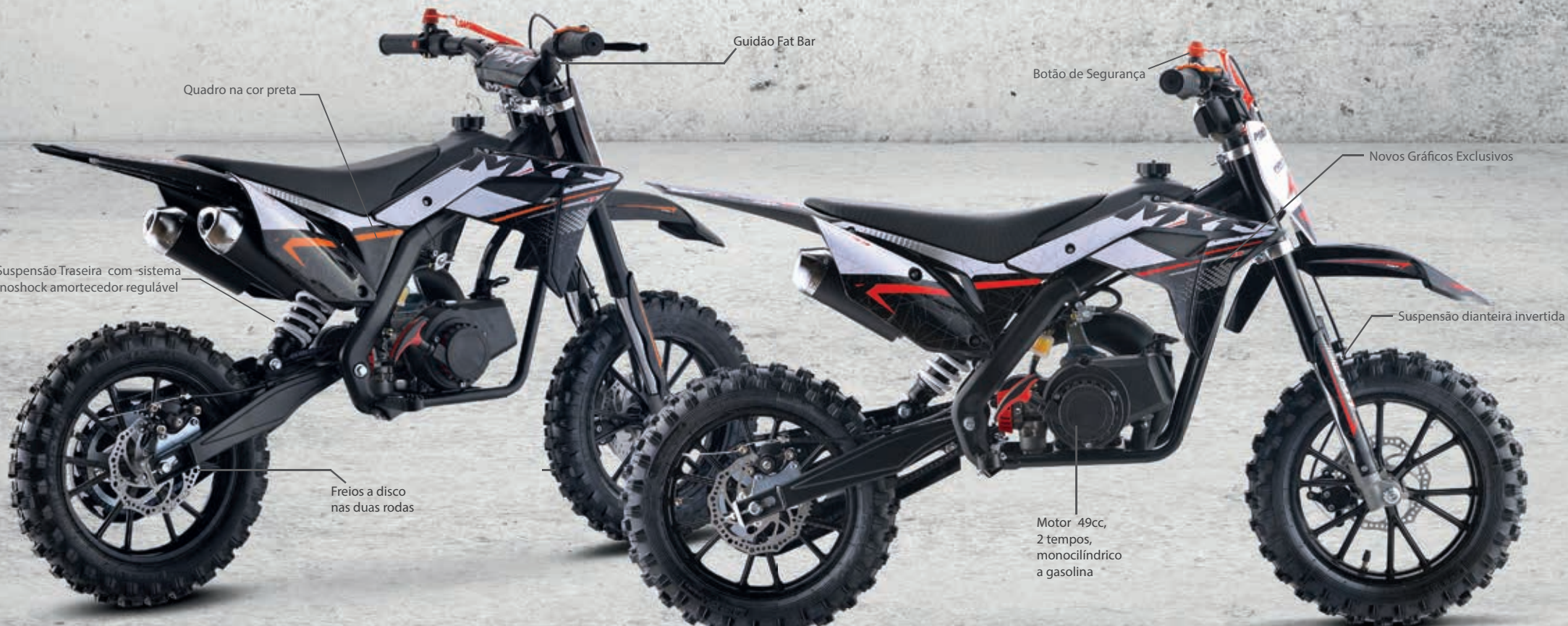
Quadro na cor preta